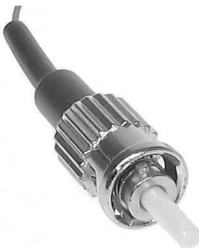
Rys. 3 Złącze ST [8]

Wadą złącz ST jest mała odporność na wsteczne pociągnięcia. Przy kablach z dużą ilością włókien ich waga może powodować ciągnięcie kabla do tyłu, a przez to doprowadzić do utraty połączenia optycznego.