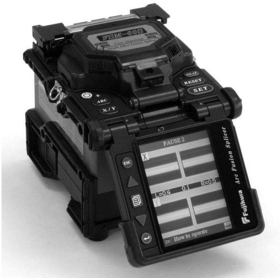
Rys. 5 Spawarka światłowodów

Następną czynnością jest już spawanie przy pomocy specjalnej spawarki światłowodowej. Po wykonaniu spawu należy pamiętać o zgrzaniu rurki termokurczliwej. Proces ten trwa około 30s. [2]