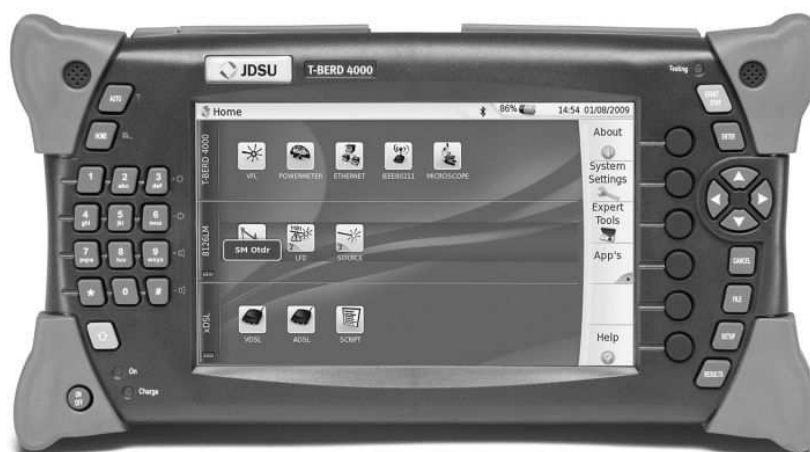
Rys. Reflektometr optyczny OTDR [7]

Pomiar strat w kablu światłowodowym wykonuje się przy użyciu miernika mocy i źródła światła na różnych długościach fali. Mierzone wartości tłumienia wykorzystuje się do określenia zgodności parametrów kabla ze specyfikacją wyposażenia lub z założeniami projektowymi. Testy powinny być wykonywane przy użyciu źródła światła o długości fali na której docelowo będzie pracował mierzony światłowód. Niezbędnym urządzeniem w codziennej eksploatacji sieci światłowodowej jest wizualny (wzrokowy) lokalizator uszkodzeń, nazywany również latarką światłowodową. Działanie tego urządzenia polega na emitowaniu światła widzialnego w celu identyfikacji kabli oraz lokalizacji uszkodzeń.