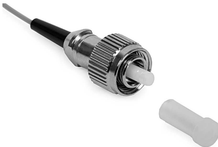
Rys. 4 Złącze FC [2]

Złącza FC są specjalnie zaprojektowane dla aplikacji telekomunikacyjnych wymagających stałego i pewnego połączenia.