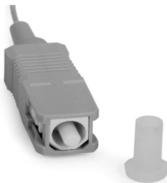
Rys. 2 Złącze SC [9]

Złącze SC umożliwia szybkie i łatwe połączenie jednej pary (w wersji simplex) lub dwóch par (w wersji duplex) włókien światłowodowych.